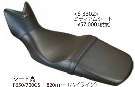
<S-3302> ミディアムシート ¥57,000 (税抜)

シート高 F650/700GS : 790mm (ハイライン) F650/700GS : 765mm (ローダウン) F800GS : 850mm シート高は純正ローシートと同等。