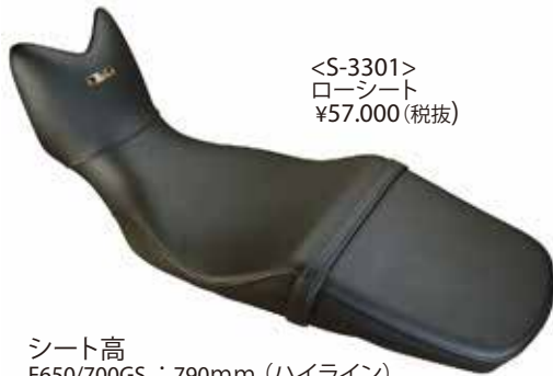
<S-3301> ローシート ¥57,000 (税抜)

シート高 F650/700GS : 790mm (ハイライン) F650/700GS : 765mm (ローダウン) F800GS : 850mm シート高は純正ローシートと同等。